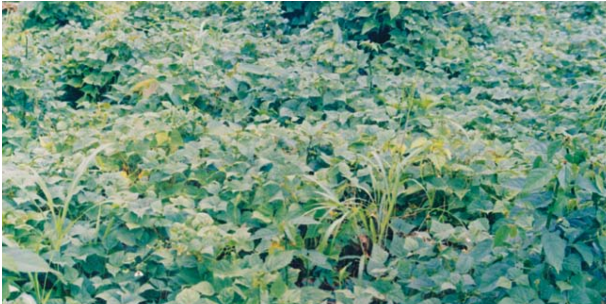
Bins ba "técnica" kat mangkaia bara dakaia, kaka Saumuk kau pain briba DOR-364.

Slaubla uya bri tasbaya nani ba pain apia sa li pain plapas an baku sin li pain utwi dimras ba mita, kan baku taim dusa ba pawras sa. Nahmuna tasbaya ba lapta piua ra kwawisa bara baha mita sip sa dusa ba pruaia. Auhyia pali bri tasbaya nani ba bins mangkaia uya yus munras sa, sakuna bahara sika bins damni ( Fasiolus acutifolius ) ba pain pawisa: