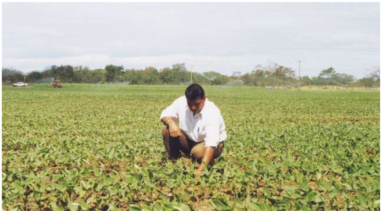
Naku nakara wan nasla ba klin briaia sa kan inma saura ba mihta wan pata maa ra sauhkisa an wiria man dakisa.

Yula ikaia saika mangkaia kainara, pas taura kulkan kaia sa dia prais wan nasla ra daiwra lupia nani bára ba.