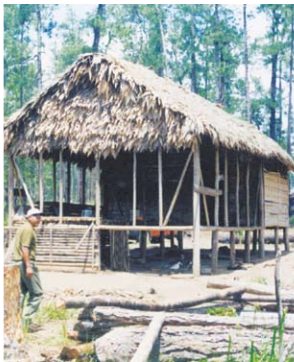
Naku natkara takrikisa sins laka tanka marikaia pliska Tasba Pain, Waspam, RAAN.